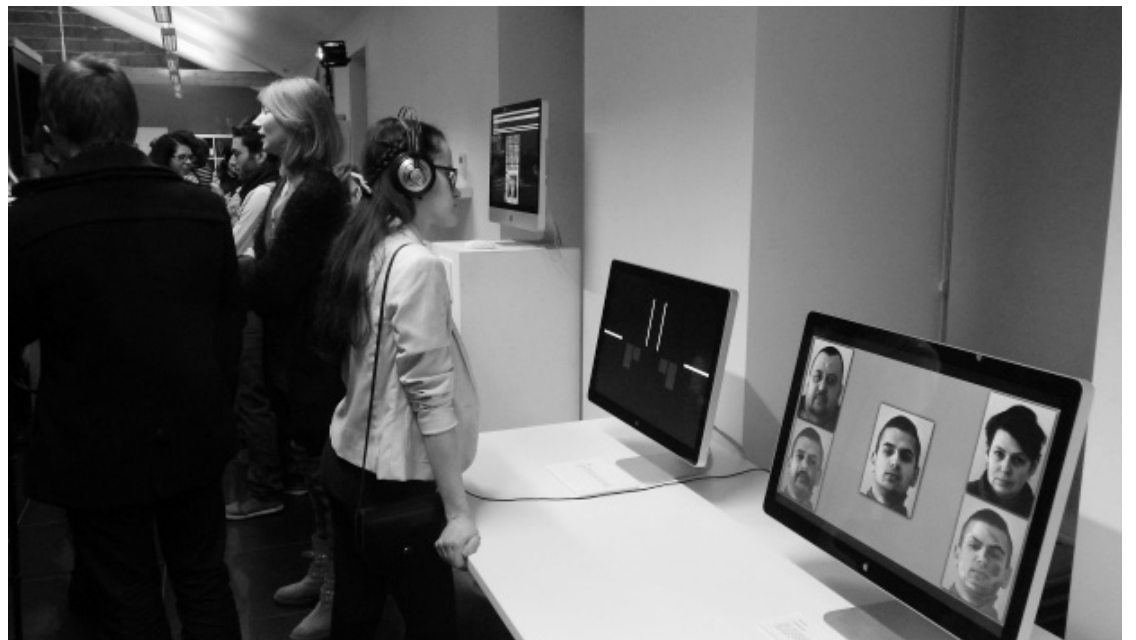
STUDENTE IEDVESMOJAS NO IZSTĀDES „TILTS” JAUNIEŠU MĀJĀ