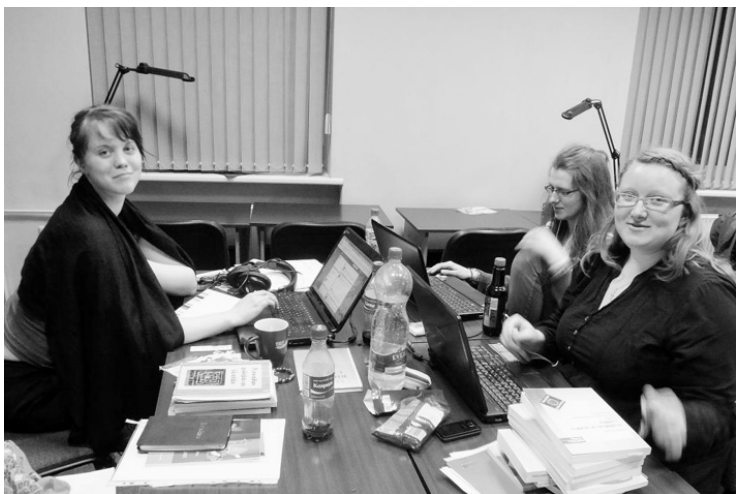
PRĀTS NEPAĢURST ARĪ TUMŠĀJĀ DIENNAKTS LAIKĀ - STUDENTI DARBOJAS "BIBLIOTĒKAS NAKTĪ"