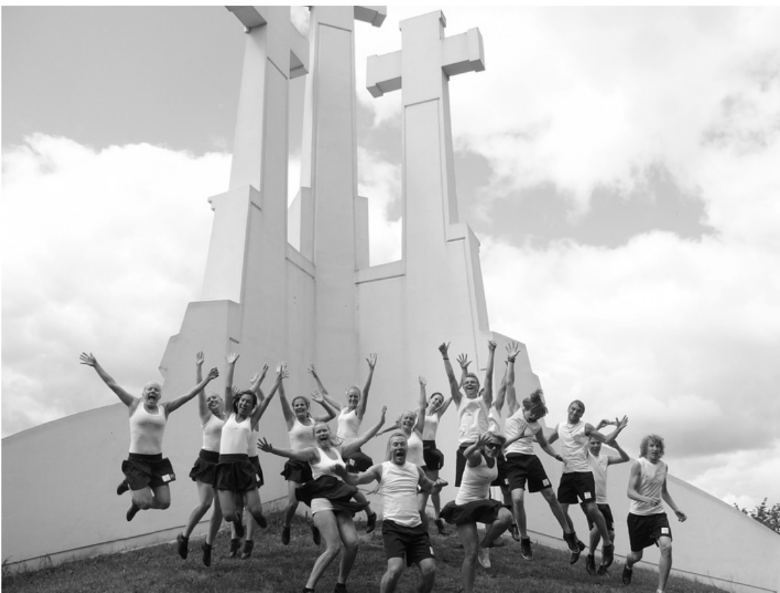
DEJOTĀJI BALTIJAS VALSTU STUDENTU DZIESMU UN DEJU SVĒTKOS "GAUDEAMUS" VIĻŅĀ