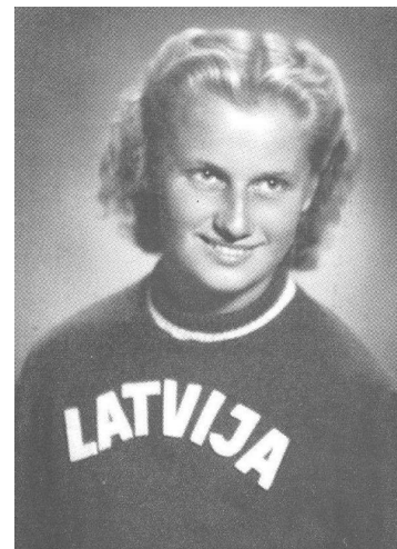
V. KALME STUDIJU GADOS LATVIEŠU VALSTS FIZISKĀS KULTŪRAS INSTITŪTĀ