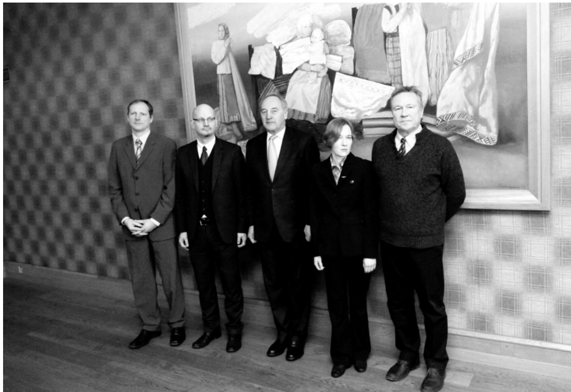
EIROPAS LATVIEŠU APVIENĪBAS PĀRSTĀVJI PIENĒMŠANĀ PIE VALSTS PREZIDENTA ANDRA BĒRZIŅA 2014. GADA 20. JANVĀRĪ.

„Projekts par latviešu mediju darbību aiz mūsu valsts robežām tapa saistībā ar manu amatu Eiropas Latviešu apvienībā. Līdz šim neviens neko tādu nebija pētījis, līdz ar to jutos gandrīz kā pirmatklājēja. Jāpiebilst, ka šis pētījums bija arī viena no mana kvalifikācijas darba daļām, kad gatavojos beigt studijas Liepājas Universitātes profesionālo studiju programmā „Sabiedrisko