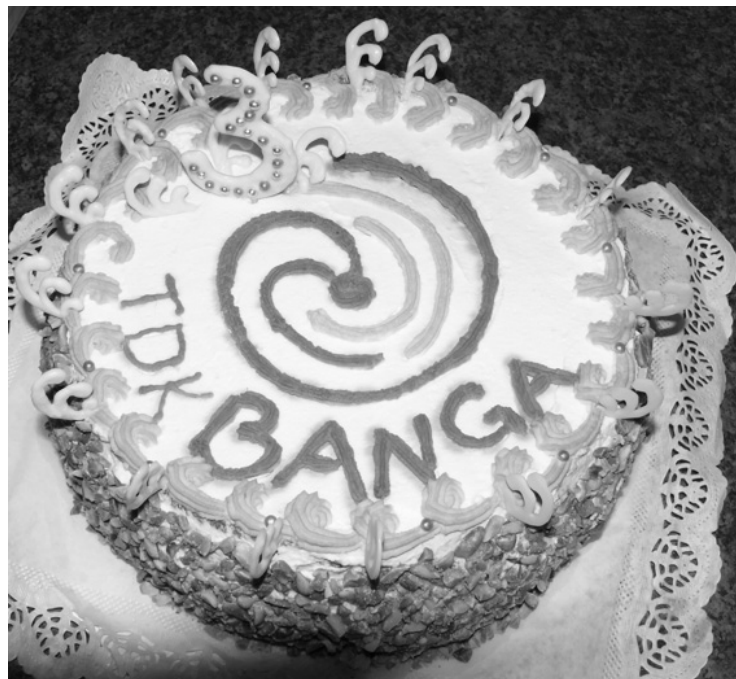
KOLEKTĪVA TRĪS GADU DZIMŠANAS DIENAS KŪKA

Pats galvenais vēlējums – daudz, daudz, daudz un vēl vairāk studentu!