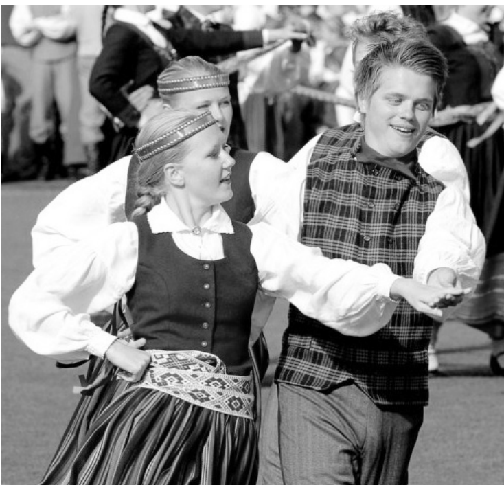
LIEPĀJAS DEJU SVĒTKI 2012