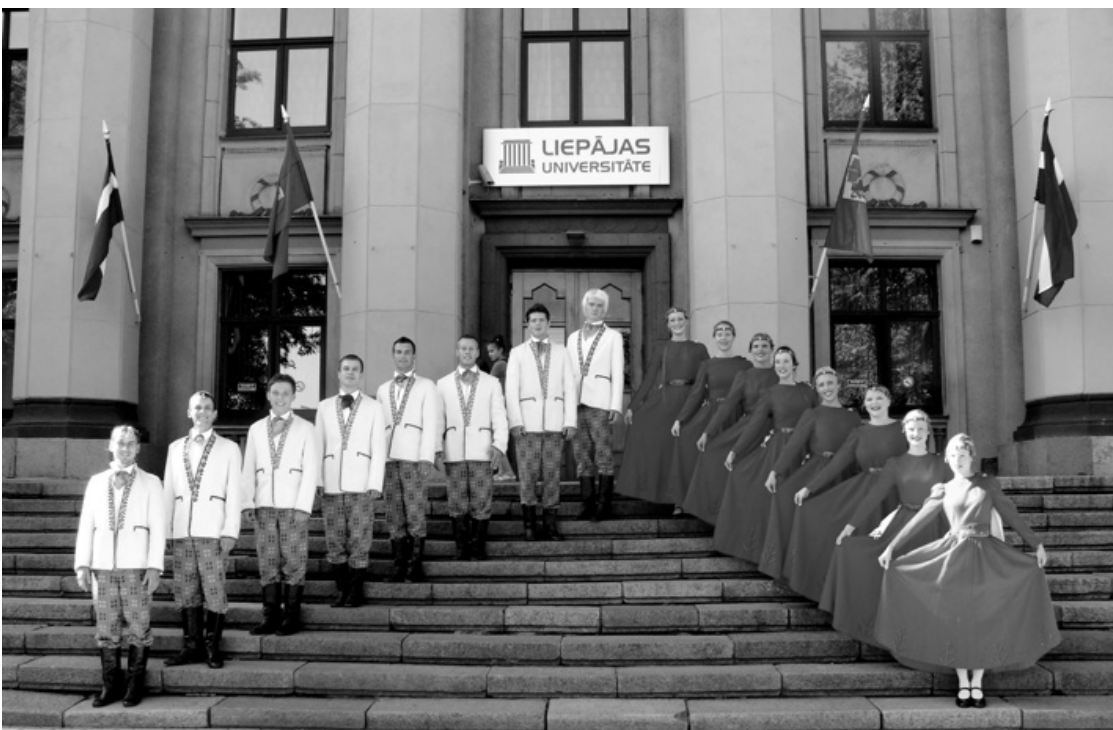
JAUNDIBINĀTAIS KOLEKTĪVS PIRMAJĀ PASTĀVĒŠANAS GADĀ