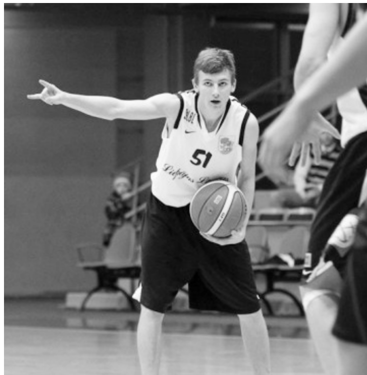
NIKS SPĒLĒJOT „LIEPĀJAS LAUVAS 2” SASTĀVĀ