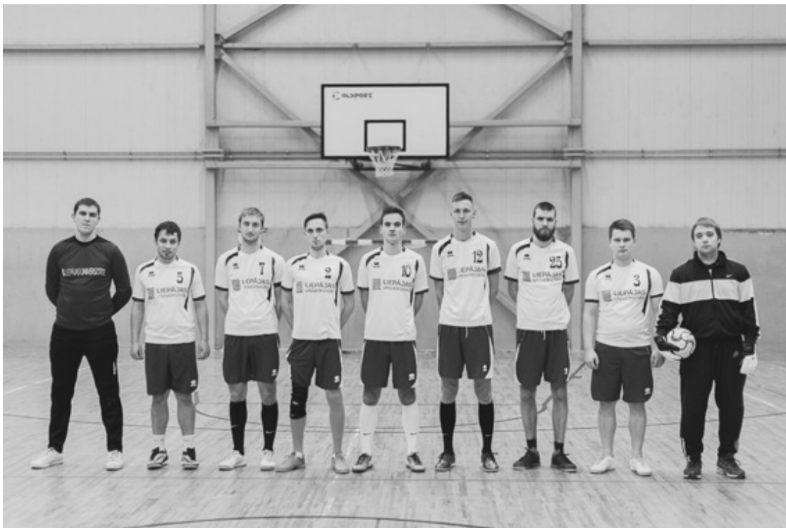
LIEPĀJAS UNIVERSITĀTES FUTBOLA KOMANDA