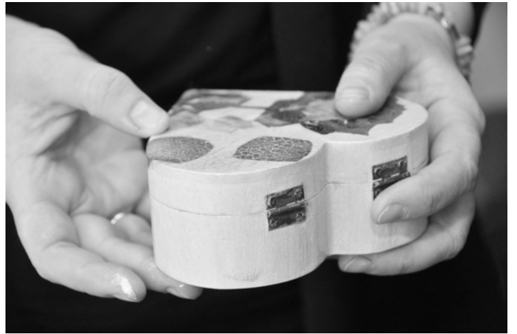
TOP ARĪ GAUMĪGAS ROTU LĀDĪTES

Uz Priekuli mākslinieci atveda vēlme būt tuvāk dabai: „Vēlējos, lai bērni izaug pie dabas. Pati esmu izbaudījusi bērniību laukos.” Dzīvojot Liepājā, sapratusi, ka parādīt dabas skaistumu bērniem nav iespējams, to var vien mazākā pilsētā vai miestā. Priekuli, kurā dzīvo jau sešus gadus, dēvē par mierīgu un sev saistošu.