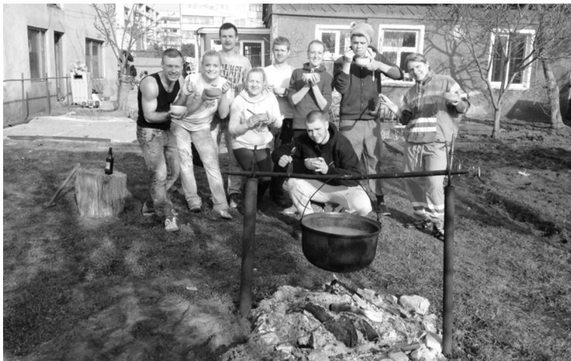
LIELĀ TALKA LAUKU MĀJĀS PIE KOLEKTĪVA VADĪTĀJAS MAMMAS