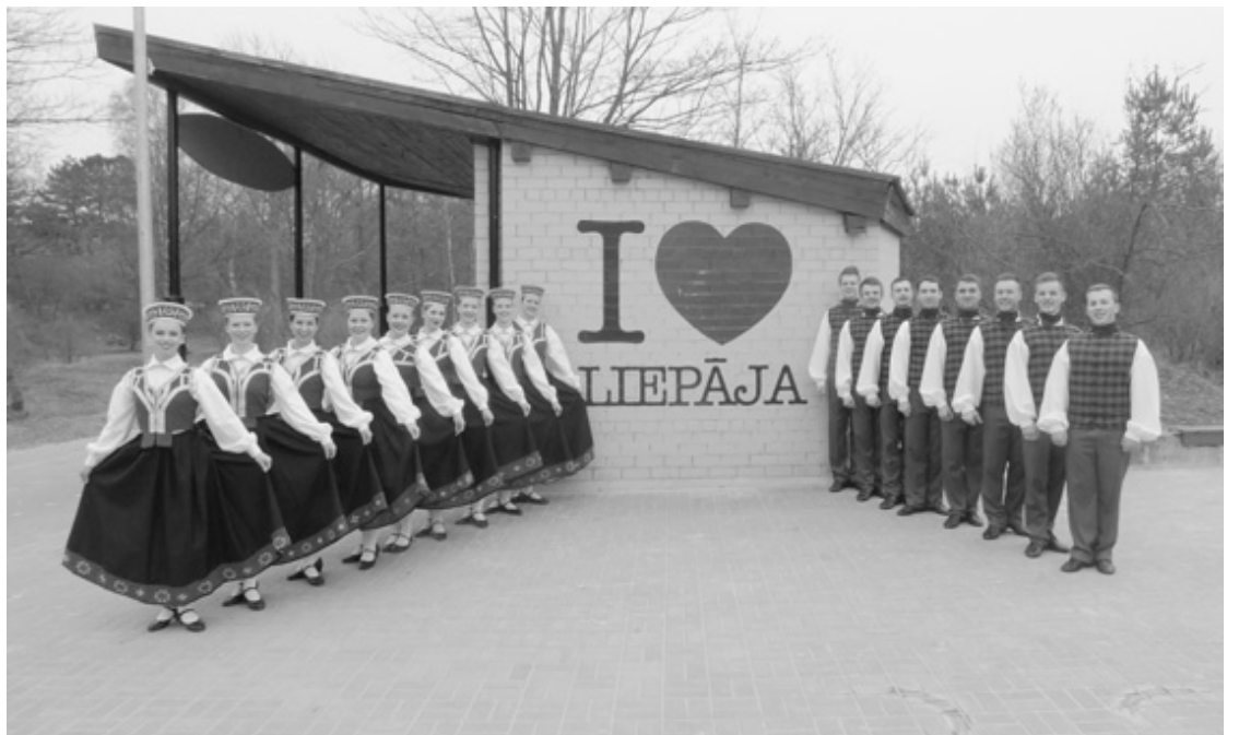
TDK "BANGA" - NE TIKAI SAVAS UNIVERSITĀTES, BET ARĪ PILSĒTAS PATRIOTI