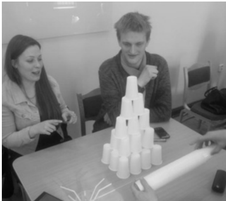
KOMANDA „LĒNĀK BRAUKSI, TĀLĀK TIKSI” VEIDO GLĀZĪŠU PIRAMĪDU