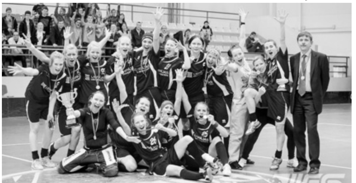
LIEPĀJAS UNIVERSITĀTES SIEVIEŠU FLORBOLA KOMANDA, IEGŪSTOT 1.VIETU

Jautājot medaļniecēm, kam viņas vēlas teikt paldies par aizvadīto sezonu, visas kā viena atbildēja, ka vislielāko paldies velta trenerim par viņa darbu un nebeidzamo motivēšanu pēc augstākiem sasniegumiem. Pateicības vārdus komanda veltīja arī Liepājas Universitātei par atbalstu, kā arī visiem pārējiem komandas atbalstītājiem, kuri visu sezonu turēja ikškus par viņām. Jaukajā gaisotnē sportistes vēlēja cita citai izturību, ciņas spar un neatlaidību, jo spēli nevar uzvarēt un medaļas izcīnīt, pateicoties vienai spēlētājai, to ir iespējams paveikt tikai komandai, esot vienam veselumam.